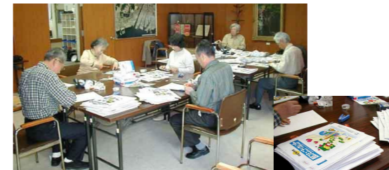
13枚揃えて、ホッチキスで止めて...

2002年度版の配布用コミュニティカレンダーを、パソコンボランティアのカレンダー担当により作成しました。ホームページ掲載分も順次更新してゆきます。