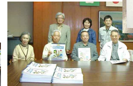
背表紙を張って、完成です。